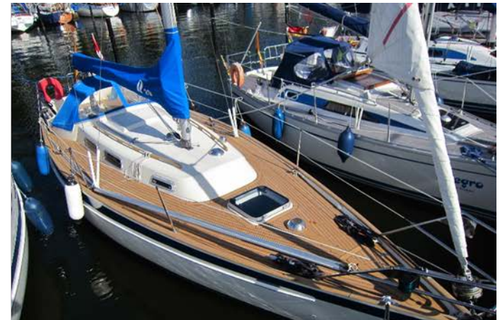
Stillechte Optik und Funktion

Übrigens: alle gebauten Scalar-Yachten (seit 1973) haben noch ihr erstes Teakdeck!