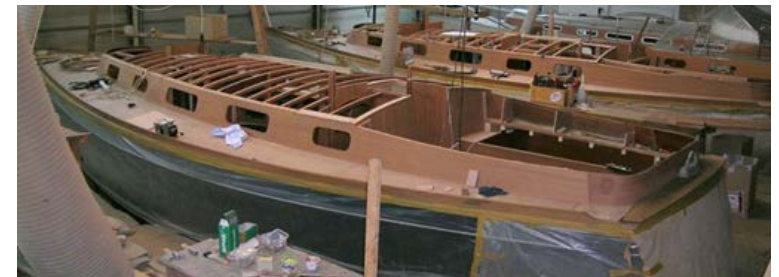
Scalar 34 im Bau – die GfK-Rümpfe werden komplett in Holz ausgebaut.