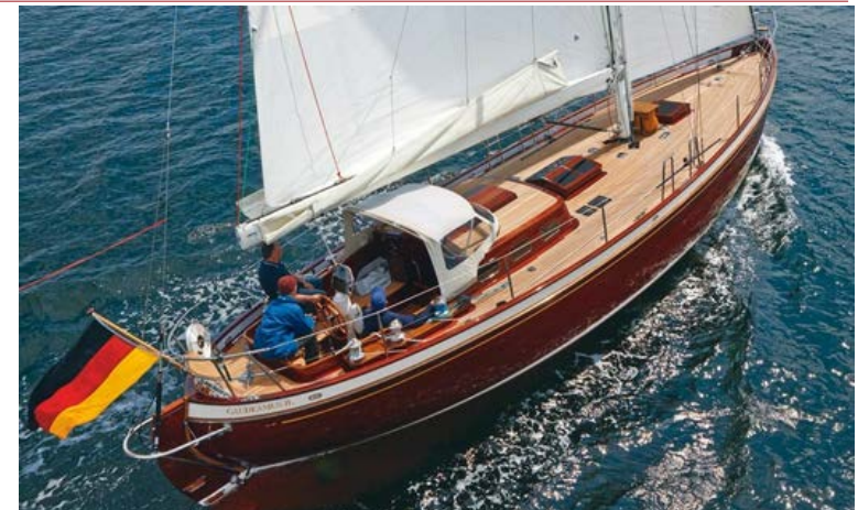
2014 Neuinterpretation des Doppelender Gaudeamus II

Persönliche Kundenbetreuung hat bei uns Priorität – von der Planung bis zur Jungfernfahrt und darüber hinaus. Oftmals bleiben die in Grauhöft gebauten Yachten für Jahrzehnte in der Obhut der Werft.