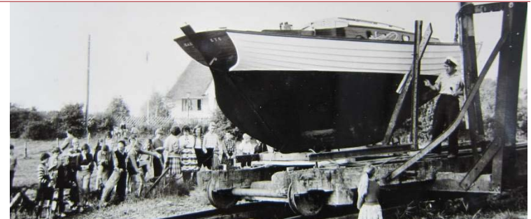
1959 Stapellauf Folkeboot „Kairos“ – heute im Familienbesitz