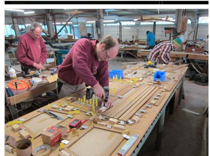
Sorgfältige Vorbereitung & Fertigstellung