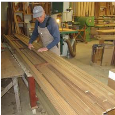
Ausgesuchte, lange Hölzer