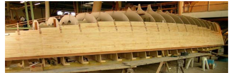
Ein Holzrumpf entsteht (Leistenbauweise)